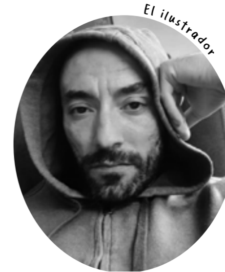
Marc Sintes @sintespons.art

Natural de Bilbao, es coordinadora del aula pedagógica hospitalaria del Hospital General Universitari de Castelló. Es doctora en Pedagogía por la Universidad de Deusto, con una tesis doctoral sobre Inspección Educativa, licenciada en Psicopedagogía, maestra y preparadora de oposiciones de educación primaria, así como integradora social y monitora de personas con discapacidad intelectual. En Ximet, no te preocupes, sigue adelante ha transmitido la confusión y las contradicciones a las que se enfrenta un preadolescente que acaba de debutar en diabetes mellitus .